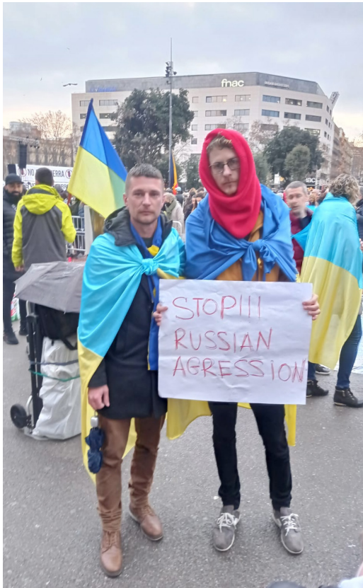
2 joves ucraïnesos en vaga de fam a Barcelona

Aquesta invasió-agressió de la Rússia de Putin té una certa semblança amb la que va protagonitzar Hitler als Sudets, l'any 1938, i també amb la que va emprendre Bush a l'Irak el 2003. Nosaltres, a l'ACAT, tot i