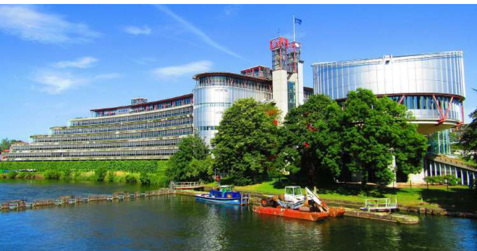
La Cour européenne des droits de l'homme à Strasbourg