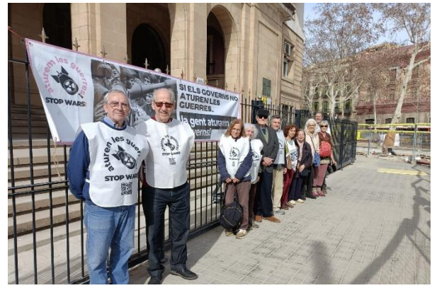
Avui a la Delegació de Defensa de Bcn, continua la plantada des del 2/11/22 d'aturemlesguerres.cat