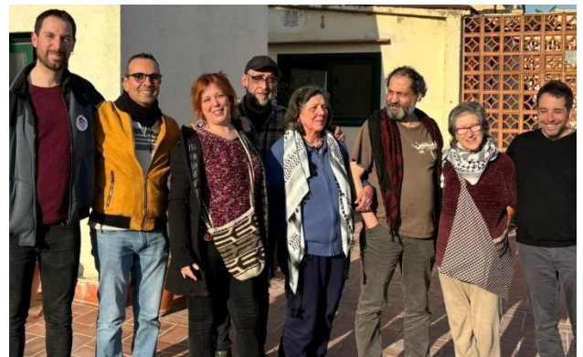
Ahir, amb el FAGC i l'equip de TransFormem UB