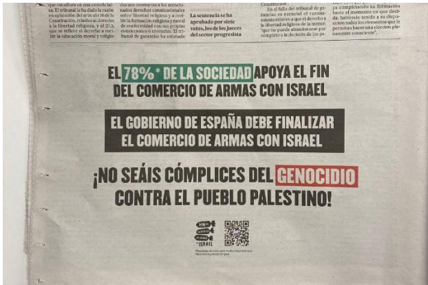
Avui, anunci a El País