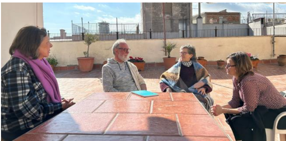
La Consellera d'Exteriors, Meritxell Serret