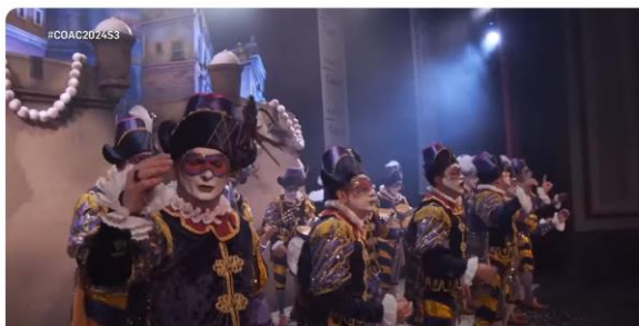
La comparsa 'El joyero' i el seu compromís amb el poble palestí | COAC 2024. En 2', més clar impossible