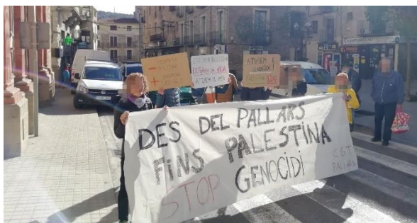
Tall de la circulació a la Pobla de Segur (Pallars Jussà)

Algunes activitats d'entitats i col·lectius: