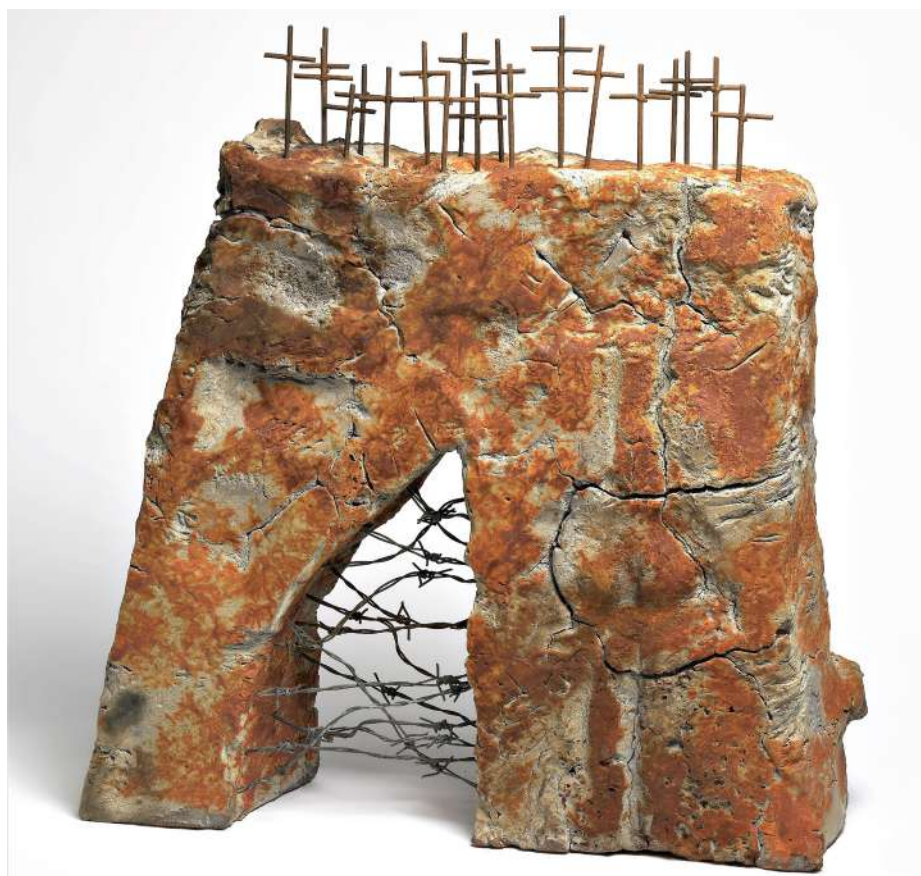
Escultura: Porta sud d'Europa Escultor: Ramon Fort

Activista en la gran lluita contra la tortura, la pena de mort i altres tractes cruels, inhumans i degradants