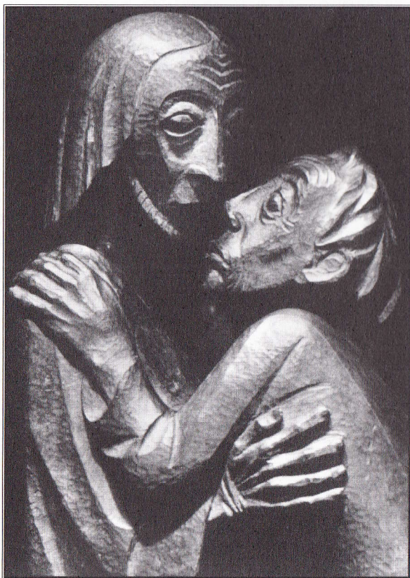
“El retrobament” ERNST BARLACH