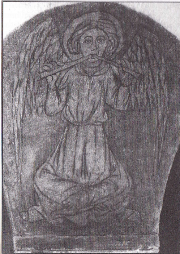
Àngel del s. XI, catedral de Bayeux

El meu pare es convertí al cristianisme, i jo vaig ser educada com a anglicana. Molts anys més tard, vaig descobrir la Societat Religiosa dels Amics, més coneguda com a Quàquers. Una de les raons que m'hi van atreure va ser llur afirmació que tota vida humana és sagrada, perquè hi ha "quelcom de Déu" en cadascun de nosaltres. Els quàquers no professen cap doctrina establerta: llur convicció que tota vida humana és sagrada i que la nostra humanitat comu-